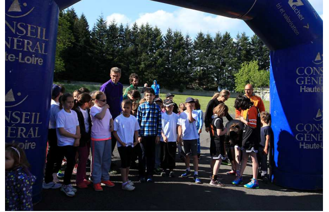
La Cool et Verte