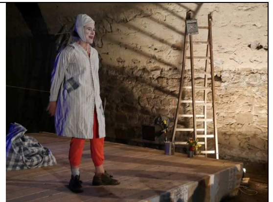
Le festival des trois chaises