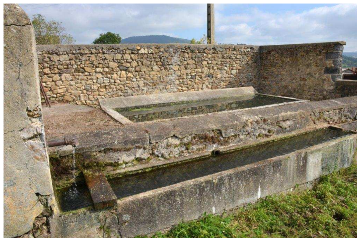
Le lavoir de Chaduzias

Pour notre part, nous avons pris et appris au travers de ces visites auxquelles tous les élus ont participé. Nous avons pris beaucoup de plaisir à vous rencontrer, à approfondir notre connaissance des lieux. Nous avons appris à mieux cerner vos problèmes et vos attentes. Tout ne se fera pas en un jour, mais il faut bien commencer ...un jour.