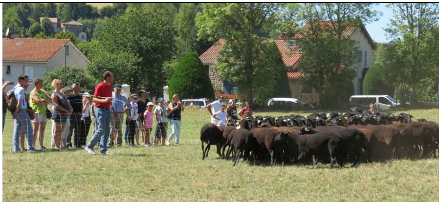
La fête de la Neira