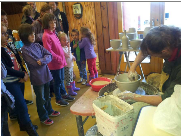
Le marché bio