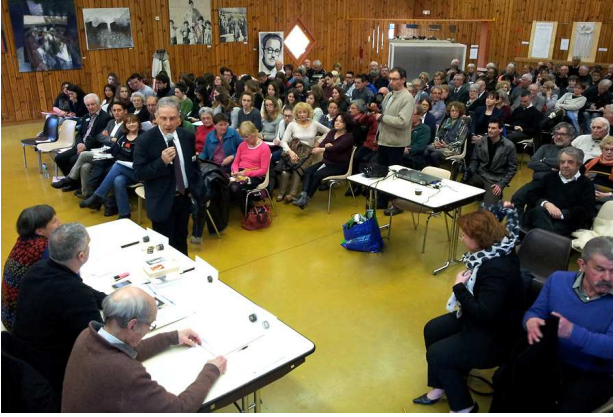
La journée Germaine TILLION