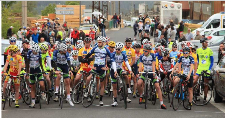
La course cycliste de Pentecôte