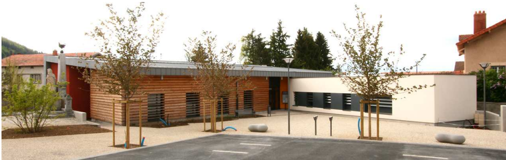
La maison de santé pluridisciplinaire