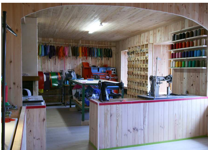
Une partie de l'atelier

Et depuis peu, l'atelier « Fleur de cuir ». Le magasin est situé dans l'ancien cinéma d'Allègre (juste derrière l'ancienne gendarmerie) il s'agit d'un atelier de fabrication artisanale de maroquinerie. Nous vous invitons à lui rendre visite.